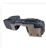
■ Arco di sospensione