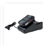
■ Batterioplader til sikker og stabil opladning