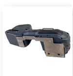
■ Ophængsbøjle til stationære pakkestationer